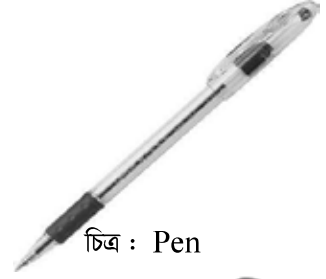
চিত্র : Pen

৩. প্রশ্ন IS THIS A PEN ? ইয়্ দিস্ আ পেন্ ? এটি কি একটি কলম