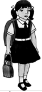
চিত্র : girl

উত্তর No, this is not a boy, but this is a girl.