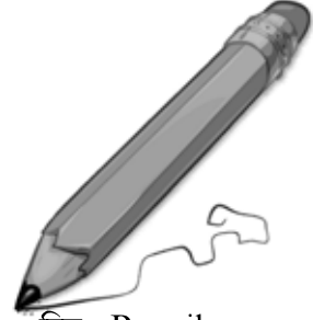
চিত্র : Pencil

উত্তর No, it is not a pen, but it is a pencil. নো, ইট্ ইয়্ নট্ আ পেন্, বাট্ ইট্ ইয়্ আ পেন্সিল্। না, এটি নয় একটি কলম, কিন্তু এটি হয় একটি পেন্সিল।